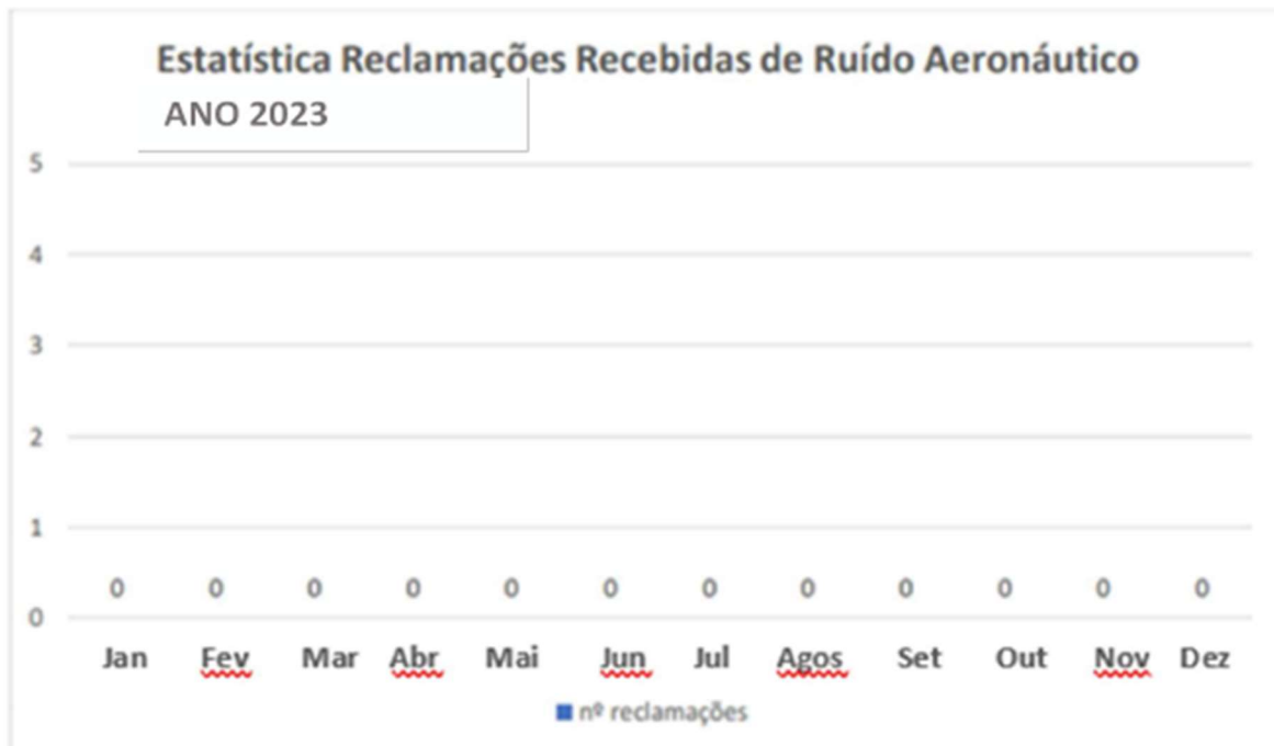
Figura 1: Estatística de Reclamações Recebidas referente a ruído aeronáutico –

Tendo como base o ano de 2023 a CGRA do Aeroporto de Ilhéus/BA não recebeu nenhuma reclamação no que refere a ruído aeronáutico, conforme gráfico abaixo.