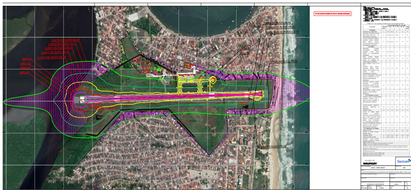
Figura 2: Mapa de Identificação de Possíveis Locais de Incômodo